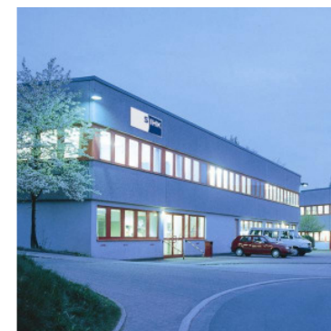
Technische Bildungsstätte Lüdenscheid

Berufsausbildung in einer außerbetrieblichen Einrichtung in Verbindung mit einem Kooperationsbetrieb (BaE kooperativ)